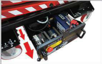
Einfacher Zugang zu allen Service Komponenten