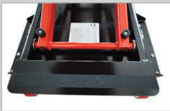
Funktionelles Design Einfach zu Reinigen